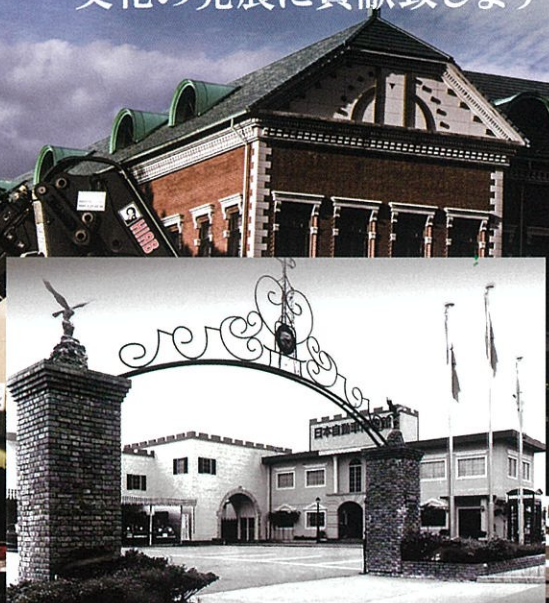
1978年10月 富山県小矢部市で開館